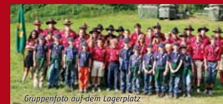
Gruppenfoto auf dem Lagerplatz

Pfadfinderlager der Gruppe 15 „St. Anna“ auf der Koralm in Kärnten vom 5. bis 18. Juli 2009 Informationen zu den Pfadfindern finden Sie auf www.scout.at/wien15 bzw. erhalten sie bei Frt. Rupert Gerig OSA ( frt.rupert@augustiner.at ).