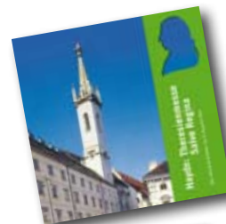
Haydn: Theresienmesse Salve Regina