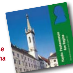
Haydn: Paukenmesse Ave Regina