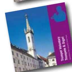
Trumpet Voluntary Trompete & Orgel in St. Augustin