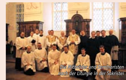
Die Mitbrüder und Seminaristen nach der Liturgie in der Sakristei