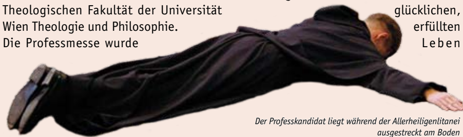
Der Professkandidat liegt während der Allerheiligenlitanei ausgestreckt am Boden