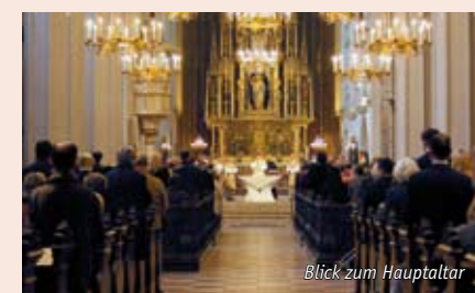
Blick zum Hauptaltar